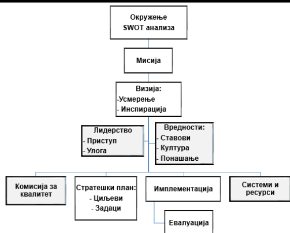
Слика 2. - Структура процеса стратешког менаџмента у процесу управљања квалитетом ППФ

ППФ континуирано преиспитује и унапређује систем обезбеђења квалитета. У циклусу од три године, детаљно се преиспитују сви стандарди и процедуре, а континуално врши њихово унапређење и побољшање. Комисија за обезбеђење квалитета је предузела радње за измену важних аката који су у функцији овако постављеног циља. На основу налаза бројних анализа које су рађене, руководство ППФ је предузело више мера и радњи у циљу испуњења општих и посебних циљева изнетих у Стратегији обезбеђења квалитета, али и ради реализације нормативног оквира којим се уређује посматрана област у земљи.