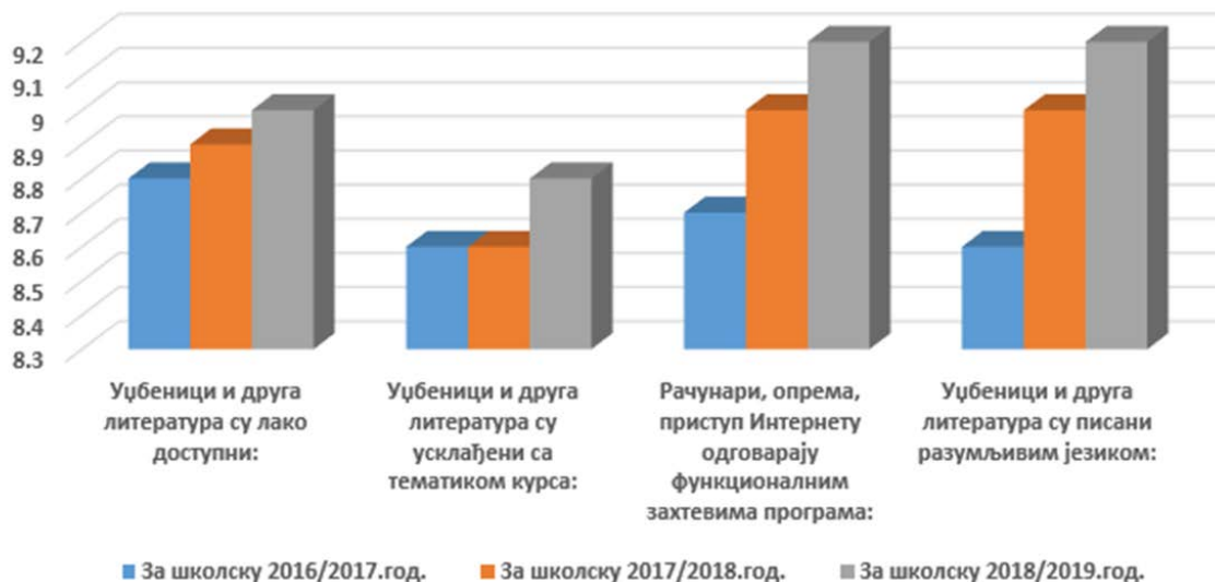
Слика 2. Упоредна анализа резултата анкете студената: оцена студената за наставно образовну литературу, приступ Интернету и рачунарску опрему у претходне три године