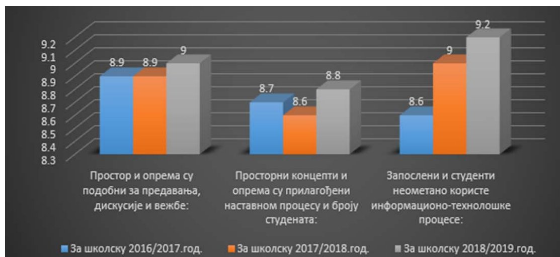
Слика 1. Упоредна анализа резултата анкете студената: оцена студената за простор, опрему и информационе технологије у претходне три године